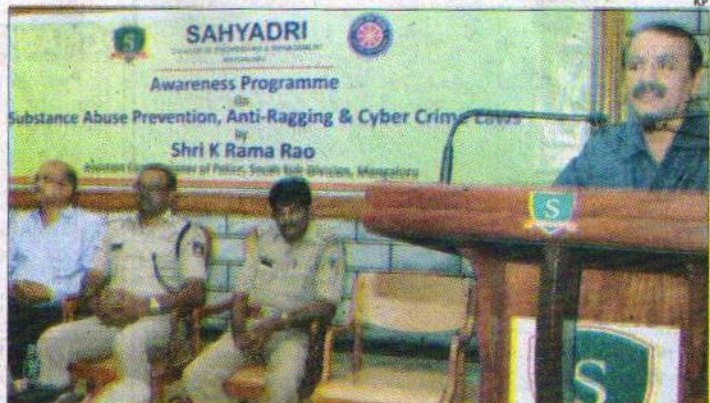
ಸಹ್ಯಾದ್ರಿ ಕಾಲೇಜಲ್ಲಿ ಮಾದಕದ್ರವ್ಯ ದುರುಪಯೋಗ ಜಾಗೃತಿ ಕಾರ್ಯಕ್ರಮ ನಡೆಯಿತು.